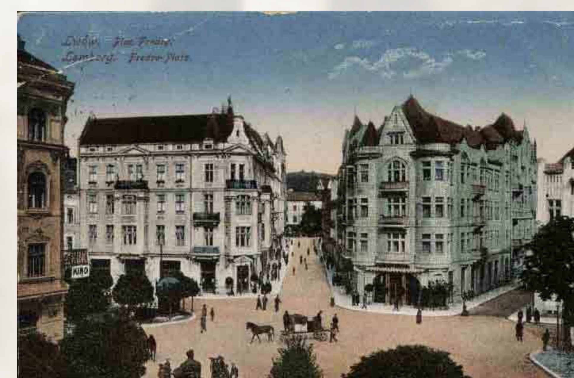
Kawiarnie Roma (z lewej strony) i Szkocka (z prawej) na placu Fredry na pocztówce z 1916 roku.

Na zlecenie Steinhausa Księga Szkocka została przepisana na maszynie. Następnie Ulam przetłumaczył Księgę na język angielski.