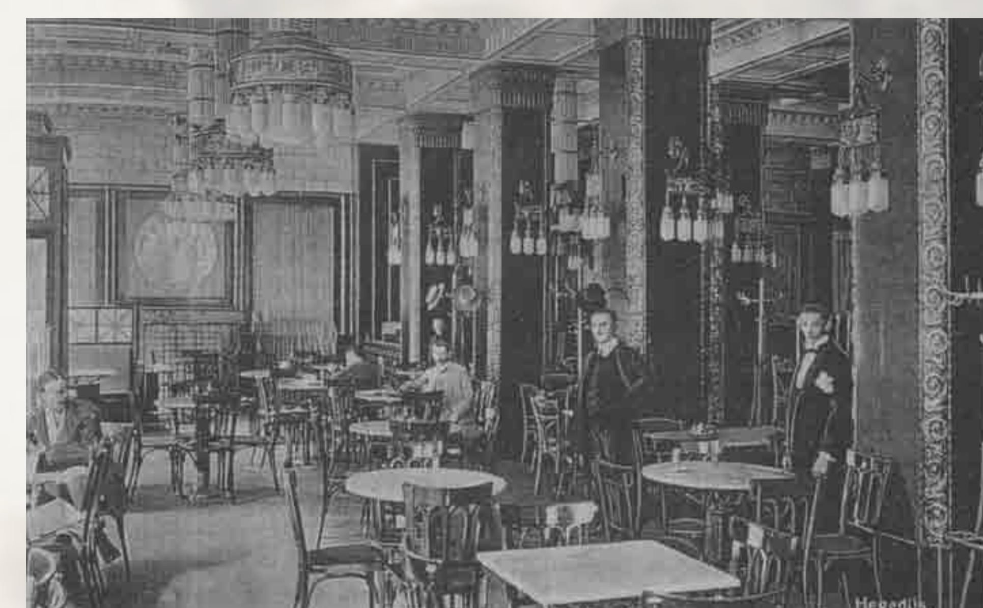
Wnętrze Kawiarni Szkockiej.