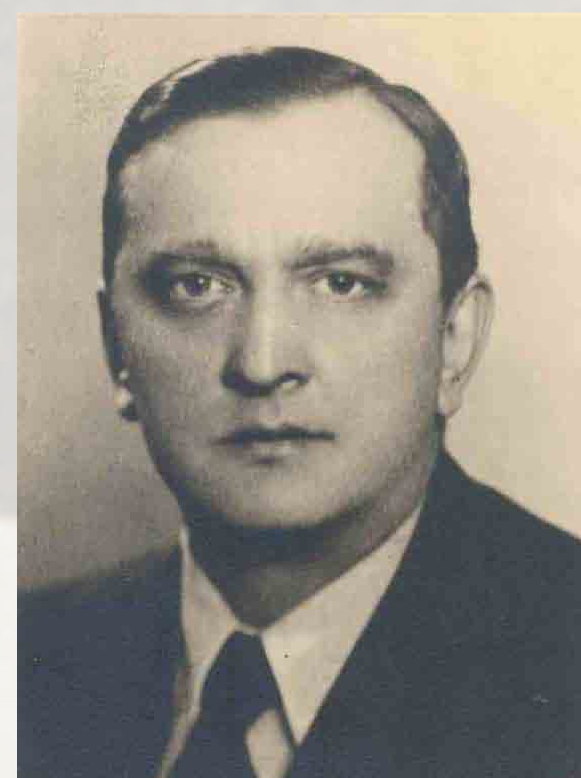
Stefan Banach w wieku 44 lat.